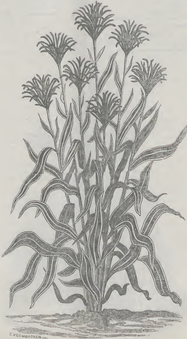
EULALIA JAPONICA FOLIIS ALBO-LINEATIS. — 3 à 5 francs.